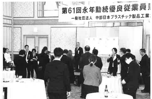
ビンゴゲームなどで盛り上がる懇親会