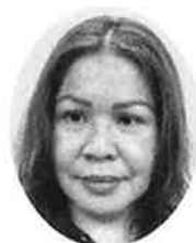
バザン パルパロナ マネタ