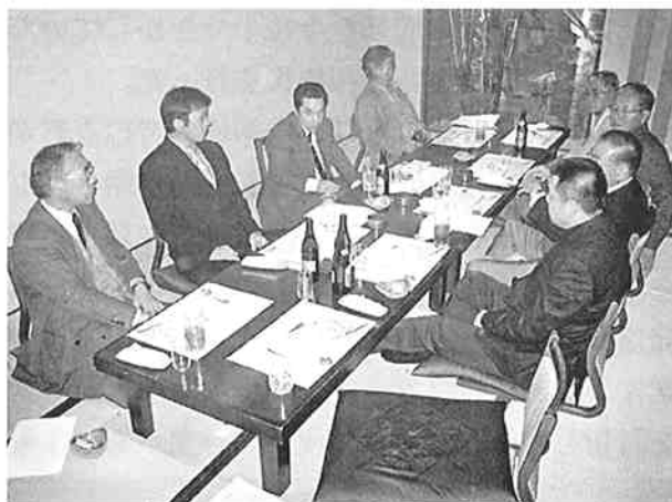
検定委員による反省会

今回このような機会を設け活発な意見交換ができたことは、来年以降の実技試験実施に向け大変有意義な機会となり、また検定委員相互の親睦も深めることができた。