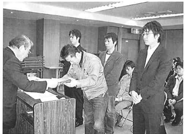
修了証を受け取る訓練生

引き続き来賓の愛知県産業労働部労政担当局長河村保氏、愛知県職業能力開発協会専務理事古田和豊氏両氏から「訓練校で学んだことを現場で生かし、更なるチャレンジを目指して欲しい」旨お祝いの言葉があり、最