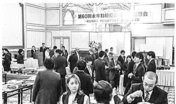
コミュニケーションを図る懇親会