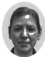
モトキロンオガブリエラ