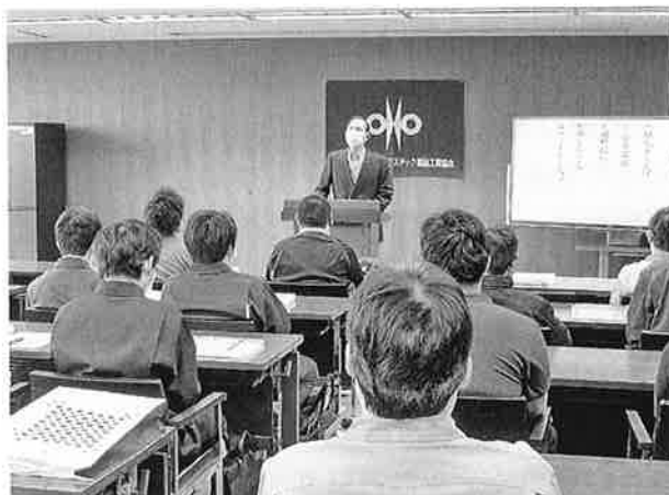
令和4年度訓練校入校式

今年度は、養成訓練（通学制）4名、向上訓練（通信制）1級6名、2級33名、合計43名のスタートとなった。