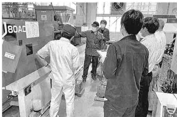
新任検定委員研修会