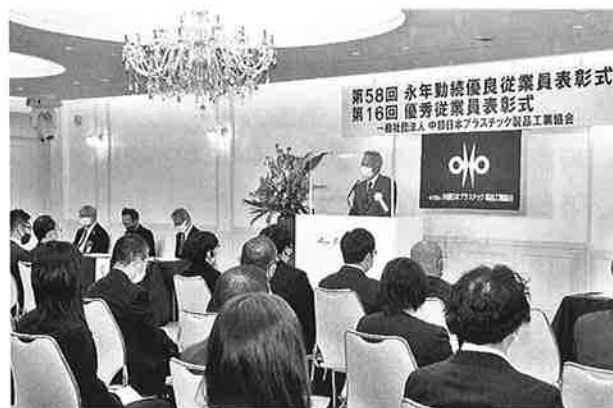
壇上は挨拶する大松会長