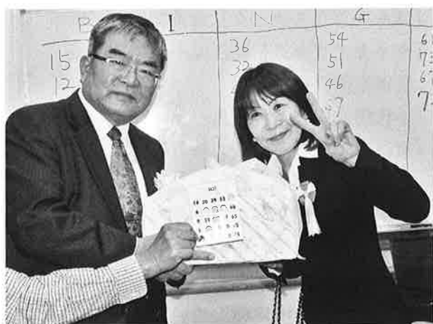
ビンゴ第一番目のスマイル