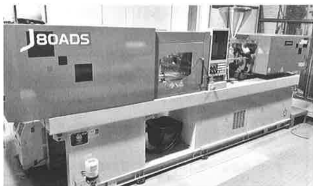
更新された日本製鋼所製の検定機

業研究所で製品検査・採点会議を実施した。昨年同様1級の製品検査を試験当日に実施したため2級の製品検査のみ実施した。総勢104名の検定委員、補佐員などの協力を得て、例年に比べ短時間で滞りなく終了することができた。