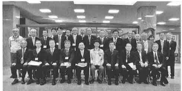
④はショールームの見学