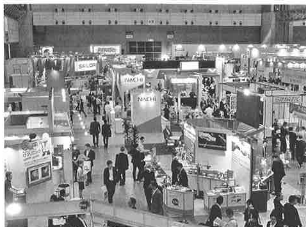
視察に訪れた「IPF2017」会場

工程設計の上で、十分なトライ&エラーを実施・分析し検証を繰り返すことは不可欠との考えである。目指すは完全なる自動化なので、今回のフェアではパッケージングまでを自動化できるシステムを期待するとともに、検査・梱包ラインが専用ではなく汎用性のあるラインに置換できるのか、また検査エラーの情報を成形