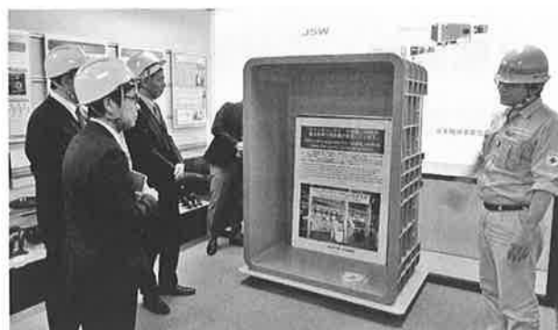
日本製鋼所・広島製作所での見学

また現在自動車分野では、車体の軽量化による燃費向上への取り組みが積極的に進められているが、その応用としてCFRTP（炭素繊維強化熱可塑性樹脂）と樹脂との融合技術や、インサート成形（金属を巻く）とは違い、特殊処理をした金属表面に樹脂を成形する成形技術の紹