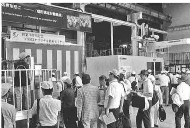
成形実演会の模様

具体的には、①成形不良の低減や成形設備のダウンサイジング化を実現する日精独自の低圧成形法「N-SAPLI™」②大物成形品への2色成形技術の活用法、2色・異材質成形により更なる機能性・デザイン性を付与可能となった複合一体成形事例③中型堅型機（220t）によるインサート成形事例④環境対応素材の薄肉ポリ乳酸（PLA）とMuCell® 技術を用いた薄肉容器成形など、モルダーらが日頃成形現場で抱えている課題を解決するための各種ソリューション技