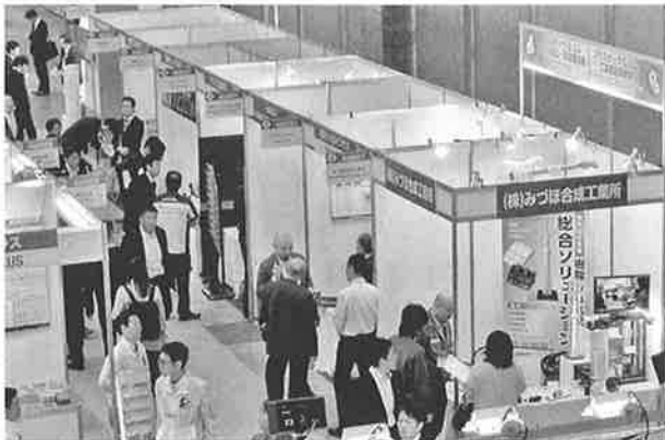
会員6社が出展した協会ブース

成、玉野化成、東洋理工、名古屋精密金型、みづほ合成工業所の正会員6社が出展し、独自の技術・製品の売り込みに余念がなかった。世界又全国から多くの人が各社のブースで足を止め、技術的な質問をするなど活況であった。