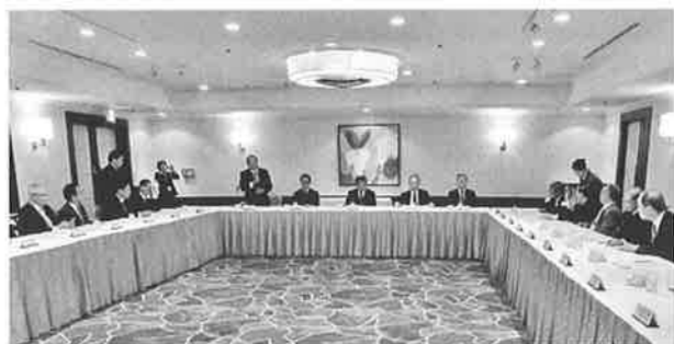
懇談会での情報交換会

昨年技能検定用成形機を電動式に更新したら、合格率が15.6%に低下した。講習会を充実させたことで今年は39.8%まで回復した。また、4