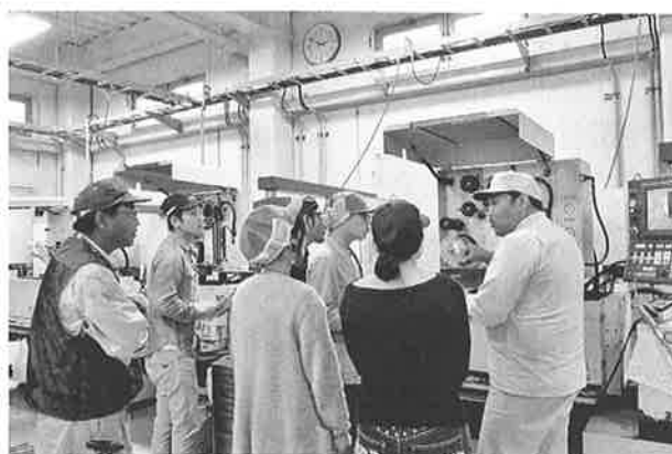
高瀬金型で加工機の説明を聞く

と説明されていたのがとても印象的で、ものづくりにおいて当たり前のものでいてとても難しいことだと感じました。とても良い勉強をさせて頂いたと思います。