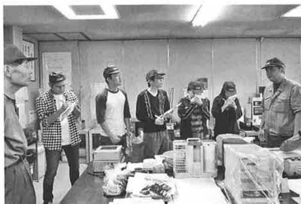
検査室で説明を聞く訓練生

同社では、サンプルを抜き出して検査を行ったり、縦型成形機を用いて“ダンベル”と呼ばれる試験片を作成したり、たくさんの検査過程を経て出荷されます。検査室でも、プラスチックが環境によって物性が変化してしまうことを考慮し、年中を通して 23 \pm 2^{\circ}\text{C} と、一定の温度環境を保ち、細心の注意を払って検査を行います。弊社でも、精密機器を使用しての検査等は、一定の温度条件を保っている部屋で検査を行うので、似たものがあると感じました。