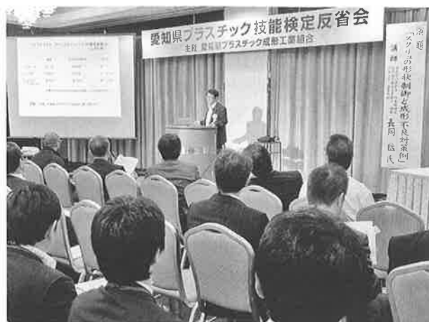
第一部の技術講演会