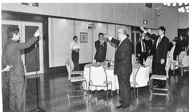
乾杯が行われる懇親会

議案審議に移り、第1・2号議案の平成27年度事業報告・決算報告の件、第3号議案役員改選の件、第4・5号議案平成28年度事業計画案・予算案の件はいずれも原案通り承認可決された。