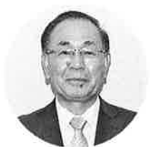
三扇化学株式会社 代表取締役社長