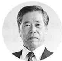
馬場化学工業株式会社 代表取締役社長

また、平成2年から現在まで組合の理事を務め、10年から4年間理事長に就任した。20年からは協会の理事を兼務し、現在は副会長を務めている。永年業界の発展に尽力した功績により27年中部経済産業局長賞を受賞している。