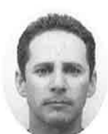
岸サンドロベルト