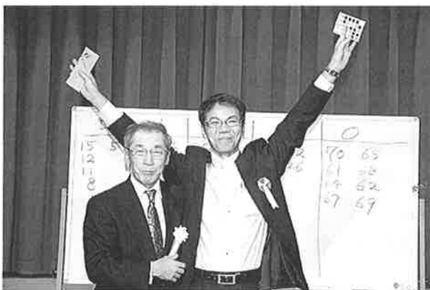
ビンゴゲームで最後の賞品を手にして喜ぶ受賞者