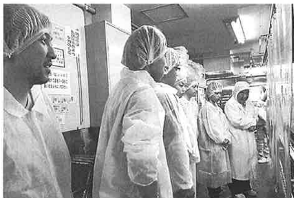
製造ラインの見学

〈感想〉タニグチ商店のラインでは、機械による自動化で玉子焼きが1時間に240個も製造できる。この自動化を進めるにあたって鍋をいくつも並べて、玉子焼きを5層にしたり、玉子焼きを混ぜるときに、何度も試行錯誤してつくった樹脂でできている箸を使うなど、こだわりが感じられた。またすべてが自動化になっているわけではなく、細かいところでは人の手が加えられていた。そこでもタニグチ商店ならではの(味)へのこだわりがあるようだ。実際に機械で製造した玉子焼きを試食させていただいたのだが、機械で本当に焼いているのか疑うほど美味でした。この味を出すための企業努力が工場を見学して伝わってきた。