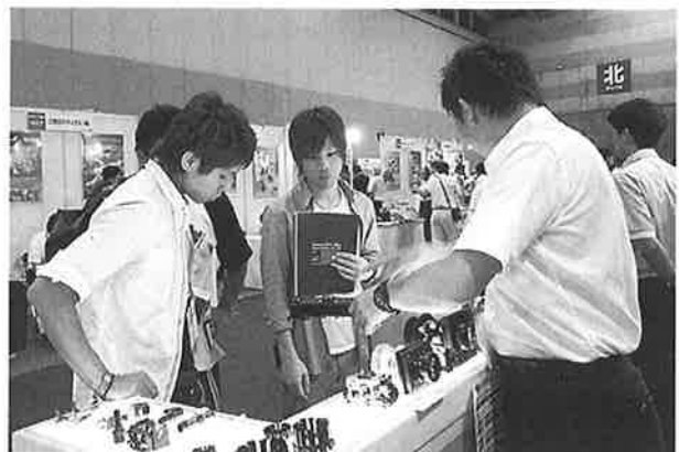
熱心に出展者の説明を聞く訓練生

実際に手に取り製品を覗きましたが、成形で造った製品と遜色ない程品質は高かったです。パソコン上や製図だけでなく実際に手に取り試作品を覗くことにより完成品のイメージが湧きやすくなり、作業効率の向上にも貢献してくれると思います。最近では個人でも買える小型のプリンタも発売されており、今後ますます技術発展のスピードが上がっていくのではと感じました。