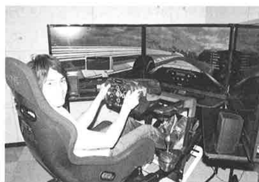
レーシングシミュレーター6