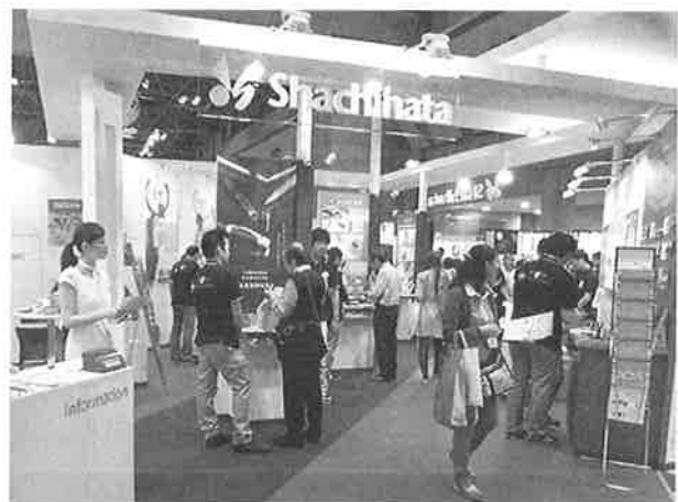
シヤチハタの展示ブース

一方、今展示会に愛知県安城商工会議所内にあるAnjo Hearts PROJECTが出展していた。このPROJECTはペットボトルのキャップの再生材ユメプラスチックからキャラクターのプラモデル「キャプラモ」を制作し販売している。