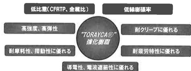
図1.トレカ®樹脂の特徴

「トレカ®樹脂」は東レが世界NO.1のシェアを誇るPAN系炭素繊維「トレカ®」を使用し、当社独自のポリマーアロイ技術、ポリマー改質技術を活用し、東レのエンジニアリングプラスチックをはじめとする熱可塑性樹脂を組み合わせることで、金属に近い強度、剛性、導電性を実現した、射出成形が可能な炭素繊維強化熱可塑性樹脂である（図1）。東レは炭素繊維長の異なる2種類の材料を提供している（図2）。