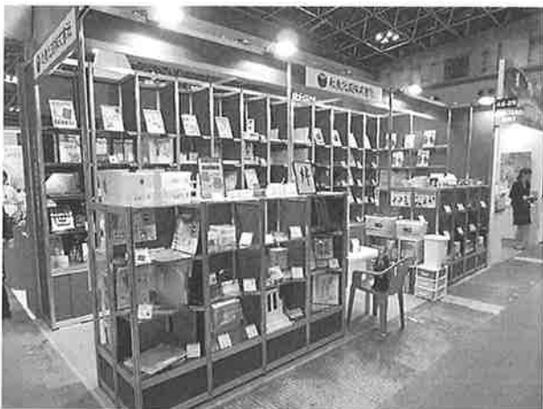
和泉化成の展示ブース

文具・事務機器の素材は、圧倒的にプラスチックが多い。プラスチックを積極的に取り入れ、その特性を活かし、より使い易く機能的でカラフル（見栄え）な商品に進化させた本当に多くの商品が開発されている。