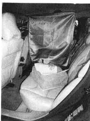
車内後部席で「くるまるくん」を広げて使用する状態