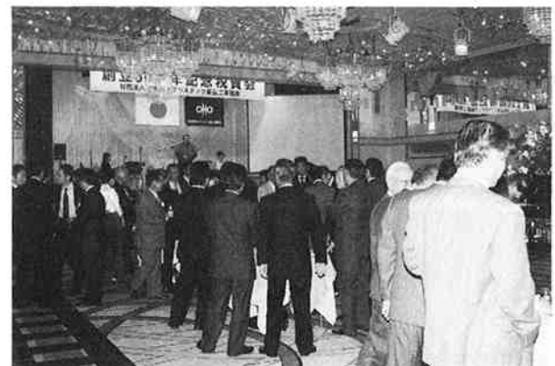
バンド演奏やゲームも行われ、一段と盛り上がった祝賀会