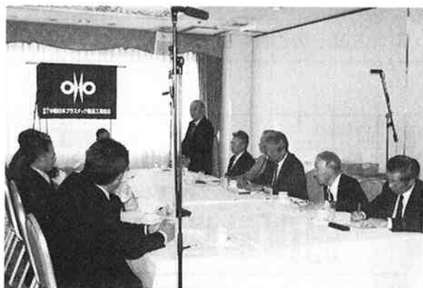
13名が出席して開かれた創立50周年記念座談会

座談会はこの後、▽自社の成長、発展のきっかけ▽協会に加入しているメリット▽受注生産という立場での経営の厳しい局面▽製造メーカーとしてのメリット、デメリット▽現在最大の課題とも言える原油高騰による材料の値上げへの対応▽求人難、海外進出への対応と企業の存続▽バイオマスプラスチックの将来性▽業界の将来像、自社の将来像▽今後の協会のあり方などをポイントに意見交換が行われ、最後に「協会の会員といっても商売については、それぞれ顧客との間で成立っている。しかし、お互いの悩みや解決策、或いは共通の課題など、腹を割って情報を交換し、自社の経営に役立ててこそ協会に加入しているメリットではないか？今後も意義ある協会として存続し、プラスチックを通じて世のため、人のために役に立って行きた