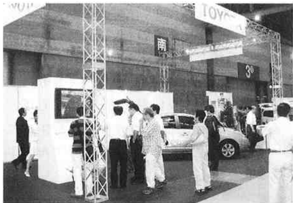
注目されるトヨタ自動車ブース

確かに消費者はガソリンを使わない車に乗るので電気自動車を利用する消費者は環境にやさしいといえるだろう。ただ肝心の電気はどう作られているのか、劣化してしまったバッテリーの処理はどうするのか、など問題の紐を解くと必ずしも環境にやさしいとはいえないのではないだろうか。他の車についてもおそらく環境に