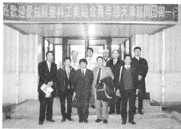
タツミ化成で歓迎の横断幕の下で撮影

業員の指導に非常に手を焼くことが多く、また「天津気質」などにより雇用の難しさもあるようだ。