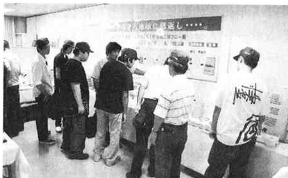
製品の展示室を見学

この工場見学で個人的に学んだことは、レジメーカーと呼ばれているこのような材料製造メ