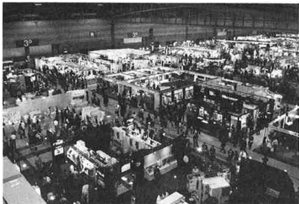
記録づくめとなった「MECE'07」3号館会場

でも、中国製ワイヤーカット装置を展示していた「株アロマH&RDコーポレーション」やCAD/CAMソフトなどを作っている「株ジェービーエム」等のブースを見ていてこの人たちが日本の工業技術の最先端を引っぱっていることを認識させられました。