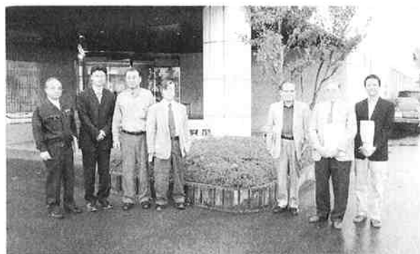
見学先のハーモ本社工場で

本社工場の見学後、伊那工場を見学したが、この工場は、粒断機の生産を行っている。工場内には射出成形機が5台ほど設置されていて、成形機ごとに設置された粒断機の作動状況も見ることができた。