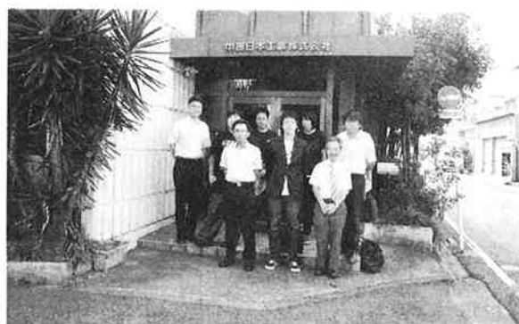
玄関前での記念撮影

9月28日の午後「金型の構造」の授業で、金型の設計・製造を行っている「中部日本工業」の本社工場を見学した。