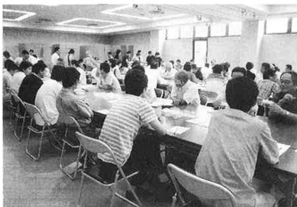
名古屋市工業研究所で行われた採点会議

平成19年度前期技能検定プラスチック成形射出成形作業1・2級の合格者が、10月10日愛知県職業能力開発協会から発表された。