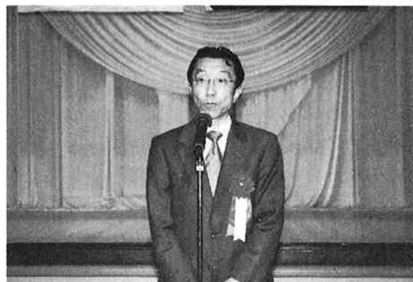
来賓祝辞を述べる 中部経済産業局産業部次長鈴木秀和氏