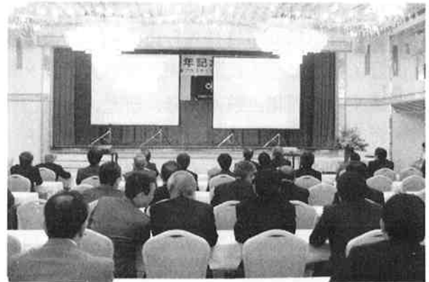
好評を受けたスライドショー