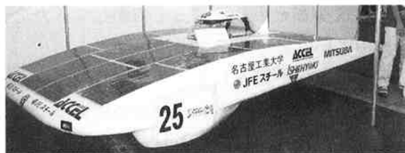
名古屋工業大学が出展した「ソーラーカー」

他にいろいろな大学が「ソーラーカー」やポートミたいなものも展示していましたが、どちらかというところのほうがおもしろく思いました。