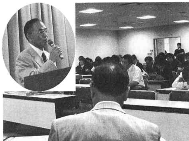
(講演する児玉社長と沢山の聴講者)