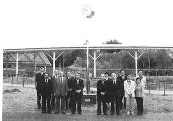
時計台の前での記念撮影 後方はガーデンテーブルとチェア