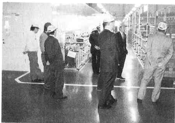
天津豊田合成を見学する一行

ここには第1・2工場があり、主に自動車部品のブレーキホース・ハンドル・内外装部品の成形・組付け・塗装作業を行っている。従業員は約1,500名が働いており、13人の日本人を各部署に配置している。少人数の管理体制では従