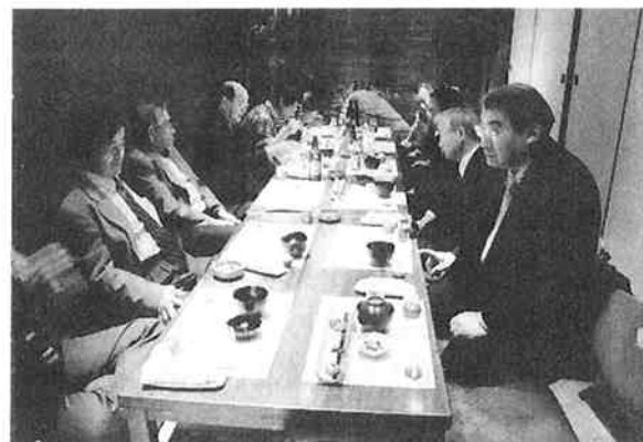
来年に向けての意見交換

今回このような機会を設け活発な意見交換ができたことは、来年以降の実技試験実施に向け大変有意義な機会となり、また検定委員相互の親睦も深めることができた。