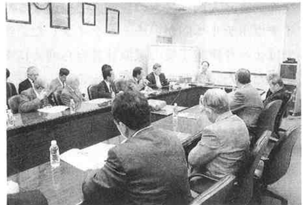
ベトナムの情勢について聞く (デンソー)

最後に、今回見学を受け入れて頂いたオハラプラスチックベトナムとデンソーベトナム2社の関係者の方々には、大変お世話になり心より感謝申し上げます。