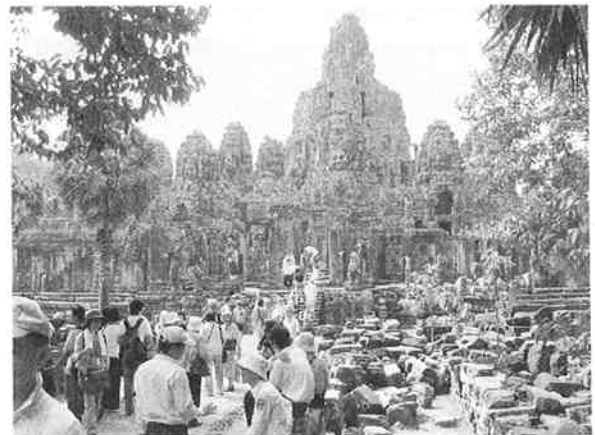
アンコールワット遺跡群

バイオンはヒンズー教と大乘仏教が入り交ざった寺院跡です。たくさんの塔の四面には京歌子に似た観音菩薩の顔が彫刻されています。また、回廊の壁面には当時の生活様式を推測できる貴重な資料や戦争、神話などが壁一杯に彫刻されています。そんなバイオンの階段を上り下りしながら集合場所に着いた時はもう足はへとへと。