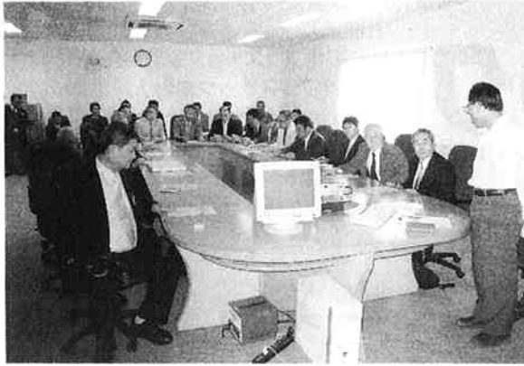
視察前の説明 (オハラプラスチック)

業団地のE-1にあり、資本金は1,000万$, 敷地面積は約56,300万㎡、工場・オフィス併せて14,775㎡で、03年8月から本格的に生産を開始した。