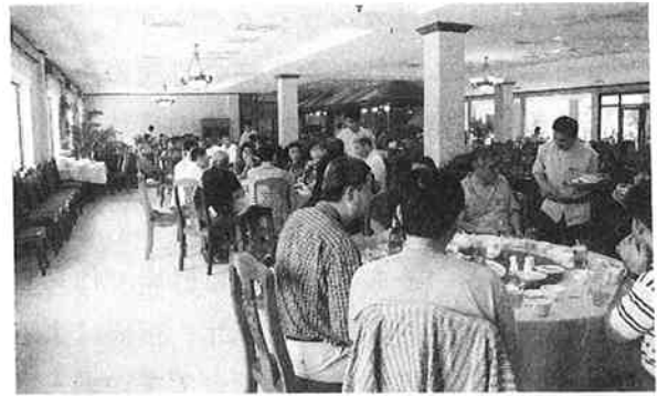
アンコールハワードホテルでの昼食

総数1,000を超えるという石造建築の大遺跡群の先ず始めはアンコールトムです。アンコールトムは一辺3kmの堀と高さ8mの城壁で囲ま