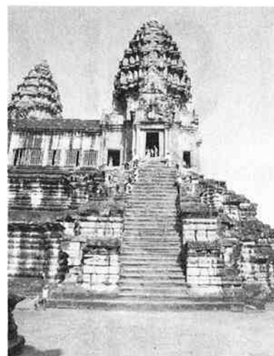
アンコールワット遺跡群

また、(株)デンソーでは、①ワイヤーボンディングの組み付けが2ラインあり、クリーンルームで多くの女性が行い、月に12万個位出荷され、不良流出は「0」。